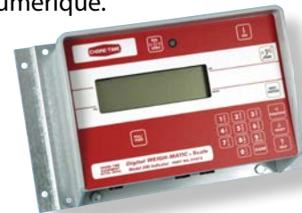
Indicateur modèle 200

conserve en permanence un inventaire de la quantité d'aliments en stock sans avoir à utiliser un silo de pesée secondaire. Le système inclut des cellules de chargement à compensation thermique et possède deux options d'indicateur de balance numérique.