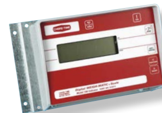
Indicateur modèle 100