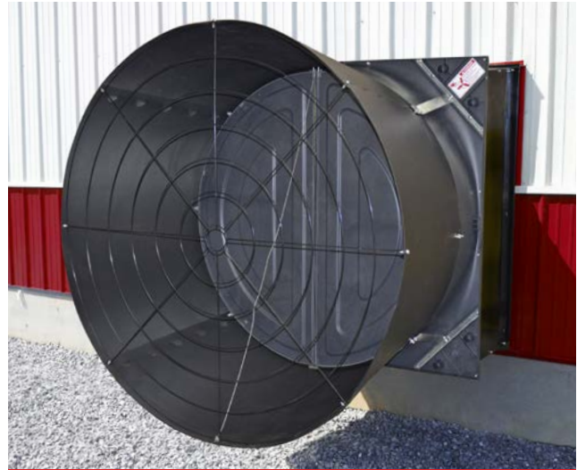
Montaje al ras