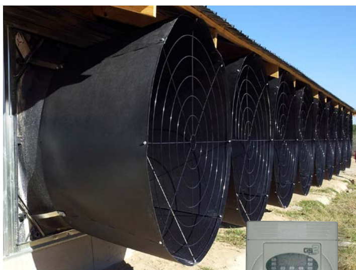
Entraîneur à fréquence variable CHORE-TIME®