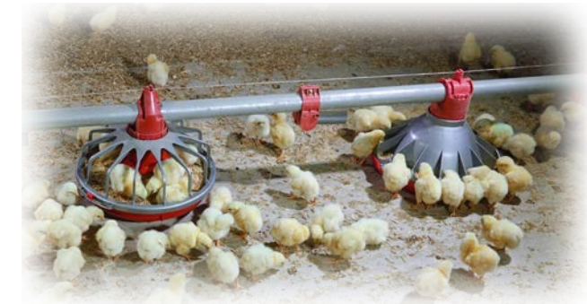
Tres días de edad