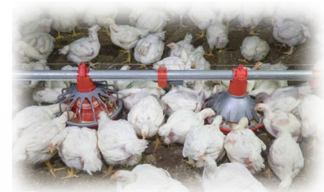
39 días de edad