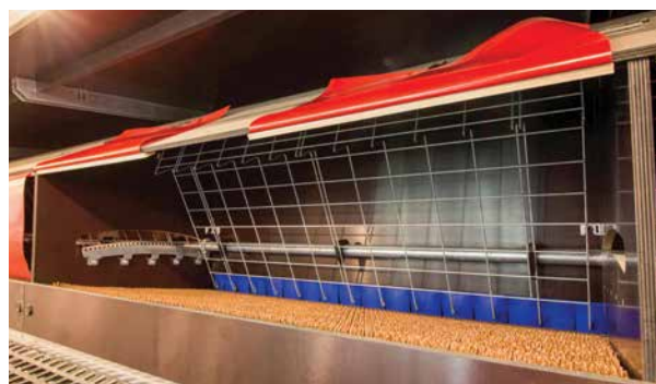
Zamknięcie gniazda z systemem RDE (Rack-Drive Expulsion — system usuwania kur z gniazda z ruchomym stelażem)

Innowacyjną cechą systemu VIKE™ jest system usuwania kur z gniazd z ruchomym stelażem (Rack-Drive Expulsion – RDE), który delikatnie wypycha ptaki z gniazda po złożeniu jaj, zapobiegając tym samym przesiadywaniu kur w gniazdach przez cały czas. System RDE pomaga chronić jaja, gdy kolektor jest włączony, oddalając się nieco od tylnej części gniazda tak, aby ptaki nie mogły dosięgnąć przesuwanych jaj. Dzięki temu maksymalizuje się procent czystych jaj klasy A.