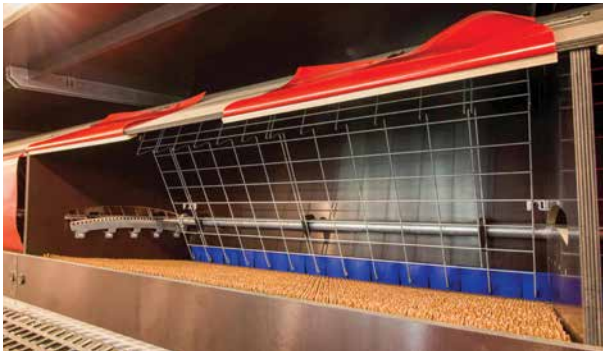
Sistema de expulsión de propulsor de cremallera (RDE)